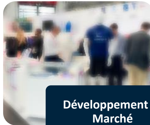
Développement et Marché