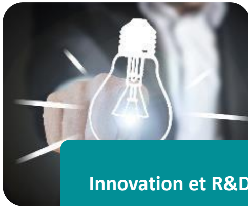
Innovation et R&D

Une offre de services dédiés répondant à vos besoins d'innovation et de développement